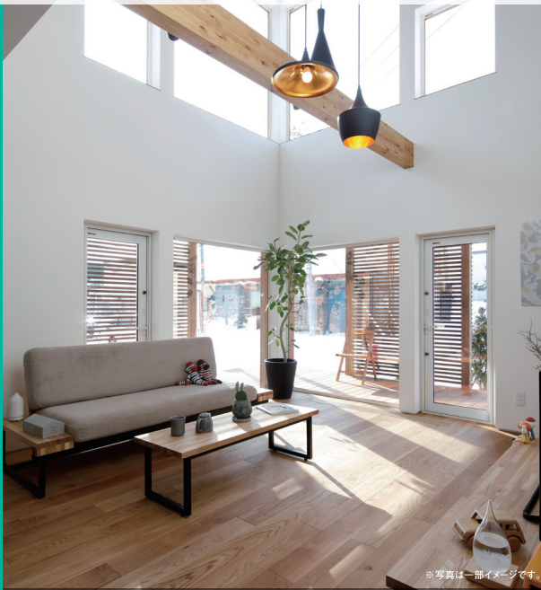
※写真は一部イメージです。